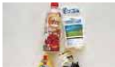
モンゴルからのお土産 左上から時計回りにどろりと濃厚100%シーベリージュース、モンゴル岩塩、ビーフジャーキー、ドライ・カード... ヨーグルトをフリーズドライさせたような食品ですが、初めての食感でした（編集者）

5月12日（月）、モンゴル国バヤンホンゴル県より視察団が訪れ、食品加工センターにて研修を行いました。視察団は特に本校の「名物」のひとつでもあるシーベリーに関心を寄せ、その活用や普及方法について熱心に質問をしていました。